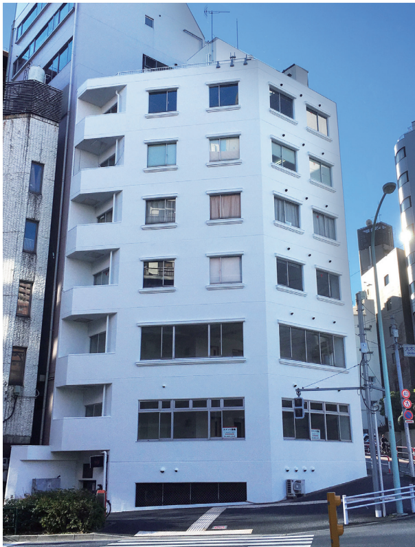
H29.12 新規外装塗り替え完了